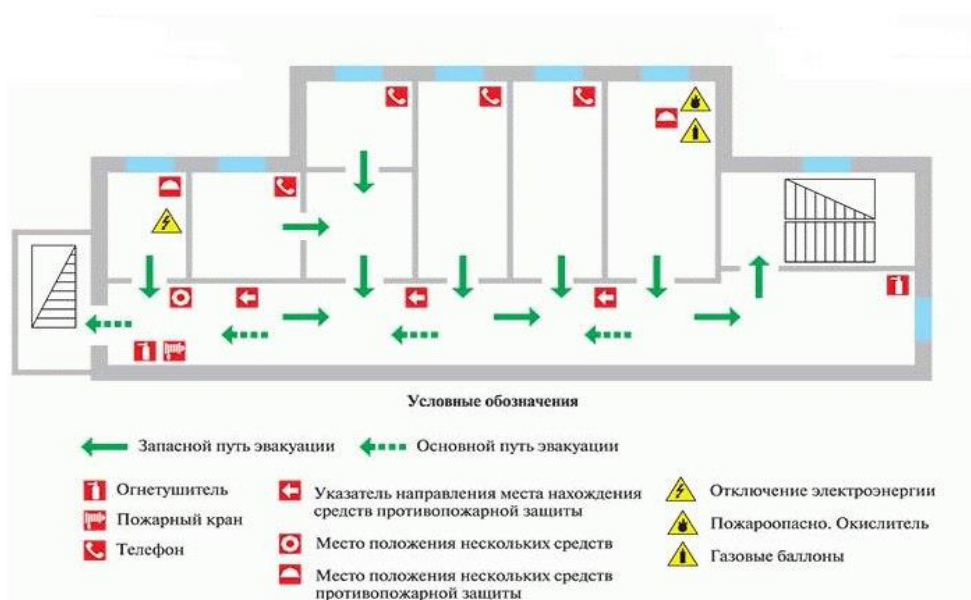
Рисунок 4.3.1 – План эвакуации людей из лаборатории

При возникновении пожара люди из лаборатории по очистке сточных вод эвакуируются согласно плану эвакуации приведенном на рисунке 4.2.